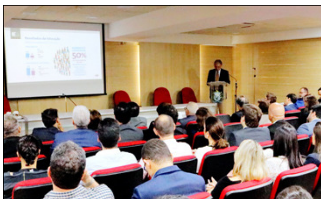
O ministro José Múcio Monteiro foi um dos palestrantes

Sem descuidar das atribuições constitucionais de julgar contas e punir os faltosos, os órgãos de controle devem evoluir de um controle burocrático para um modelo que valorize a função preventiva. Esse foi um dos pontos defendidos pelo presidente do Tribunal de Contas da União (TCU), ministro José Múcio Monteiro, na palestra "Desafios atuais dos órgãos de controle", proferida no auditório da Procuradoria Geral do Estado de Pernambuco (PGE-PE) na tarde da quinta-feira (25).