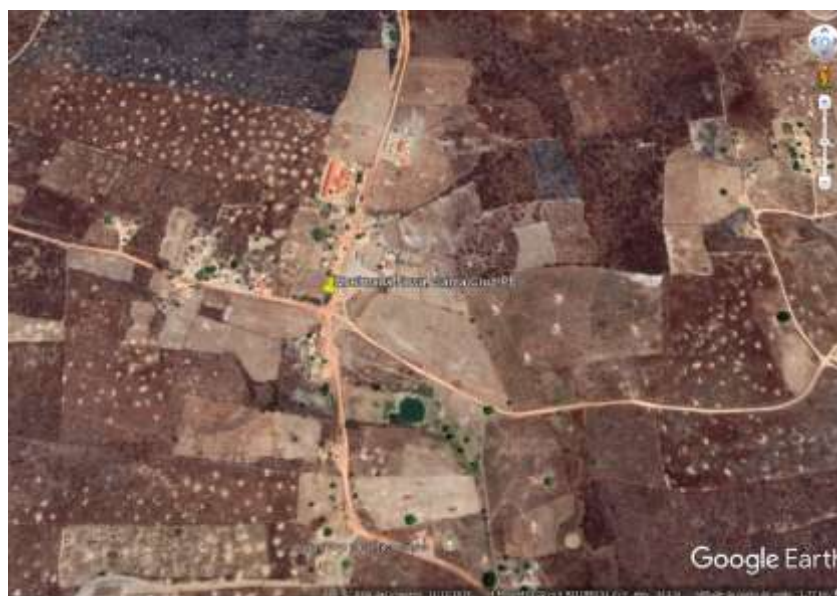
Figura 1 - Local da obra.