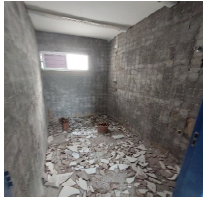
FOTO-10- WC FUNCIONARIOS