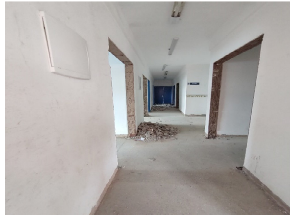
FOTO-6- CIRCULAÇÃO ESQUERDA