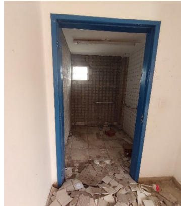
FOTO-4- WC PACIENTE