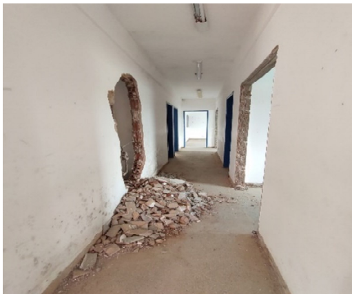
FOTO-5- CIRCULAÇÃO DIREITA