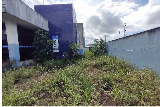
FOTO-2- AREA EXTERNA/ LATERAL