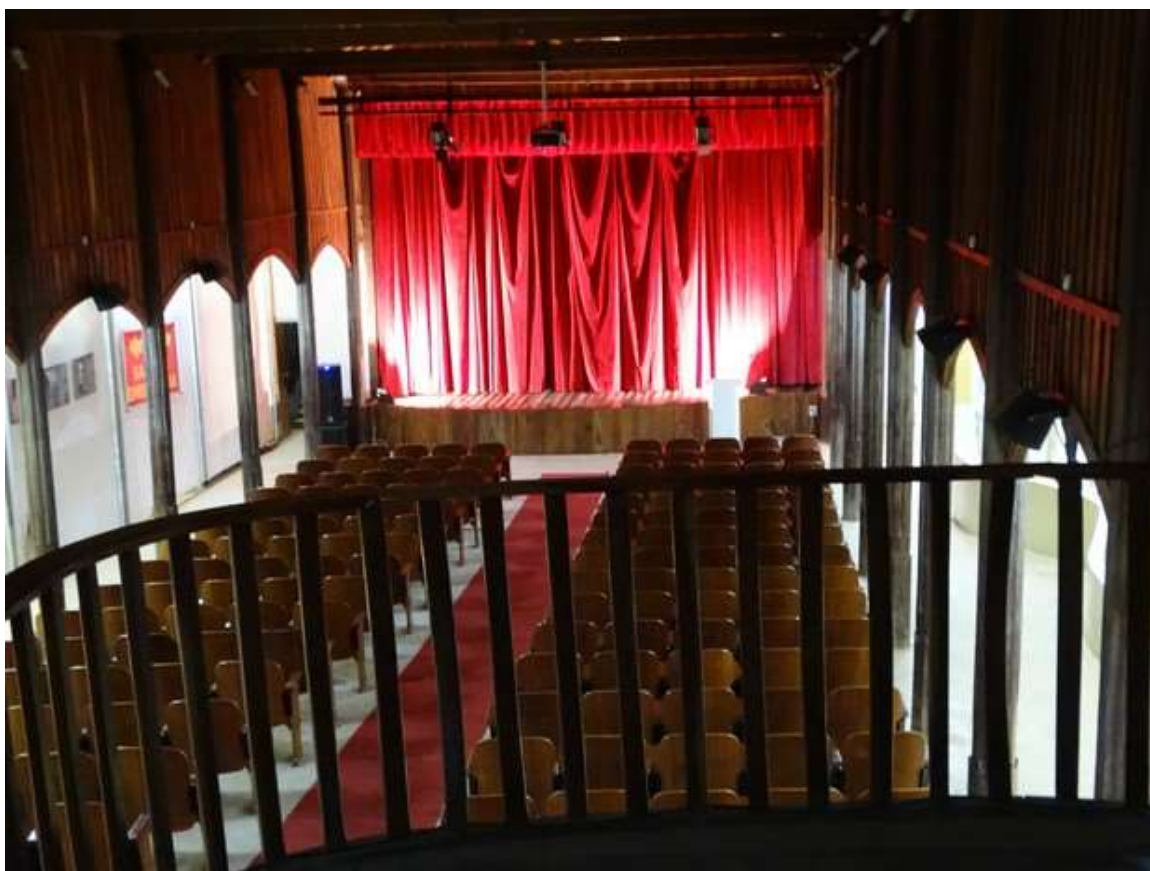
Cine Teatro Apollo foi tombado em janeiro de 1994 como Patrimônio Histórico

Outra atração cultural e histórica a ser mencionada é o FORROMARES, é uma das festas mais esperadas do Ano, por se tratar em um evento de grande porte fora de época e atrair pessoas da Mata Sul, Norte das Alagoas, Litoral e Capital. Além de proporcionar uma festa com forró fora de época para a população, o Forromares ajuda a aquecer e fortalecer a economia do município por meio da rede hoteleira e do comércio, proporcionando a vinda de pessoas de toda a região para prestigiar o evento.