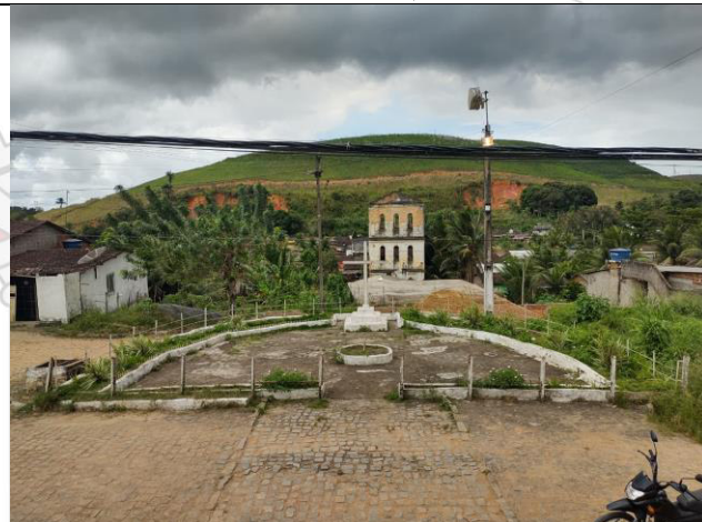
VISTA POSTERIOR DA PRAÇA DA CAPELA NOSSA SENHORA DO CARMO, MASSAUASSÚ