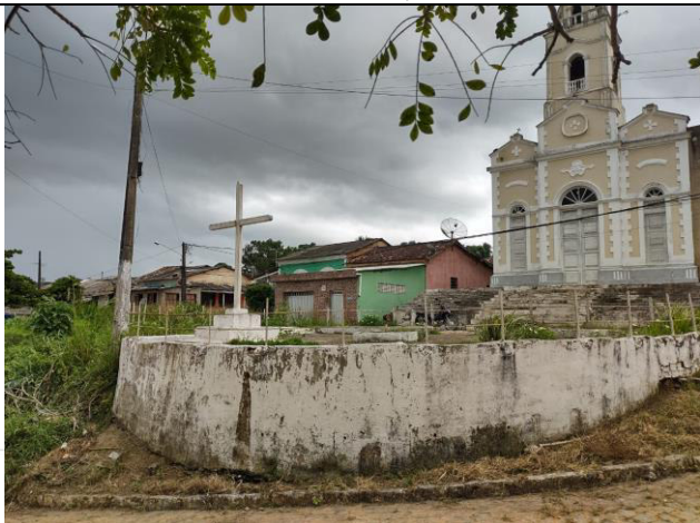
VISTA FROTA DA PRAÇA DA CAPELA NOSSA SENHORA DO CARMO, MASSAUASSÚ