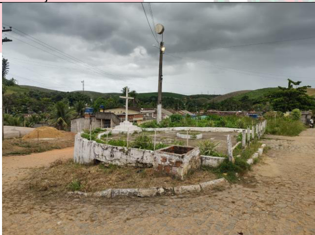
REDE ELÉTRICA EXISTENTE – UTILIZAR PARA IMPLANTAR NOVOS POSTES