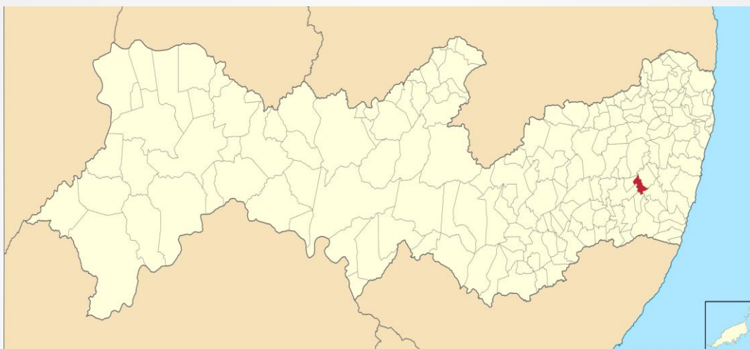
Localização de Cortês em Pernambuco