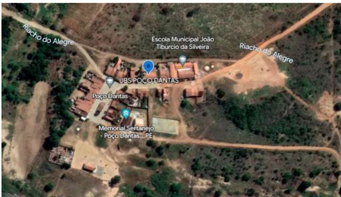
Figura 1 - Local da obra.