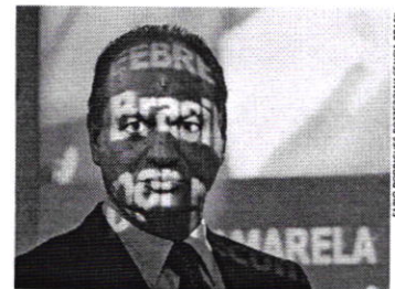
Ricardo Barros defende aumento da cobertura vacinal

Outros 2.270 casos foram descartados e 213 permanecem em investigação. Além disso, 304 casos foram considerados inconclusivos. A Região Sudeste concentrou a maioria dos casos, com 764 confirmações, seguida da Região Norte (10) e Centro-Oeste (3). As regiões Sul e Nordeste não tiveram confirmações. Mesmo com a interrupção da transmissão da febre amarela, o Ministério da Saúde ressalta a importância de manter as ações de prevenção e de ampliar a cobertura da imunização contra a febre amarela para prevenir novos casos da doença no próximo verão.