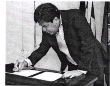
Mendonça Filho quer que obras sejam retomadas

discriminários e R$ 137,6 milhões a mais de limite para empenho do orçamento. "Estamos cumprindo rigorosamente com o compromisso assumido com as universidades e institutos federais, que têm tudo por parte do MEC toda a atenção no sentido de garantir custeio, investimento e retomar obras paralisadas", disse o ministro Mendonça Filho. As universidades federais relatam dificuldades financeiras, que impactam a rotina de estudantes. Como o jornal O Estado de S. Paulo revelou, na semana passada, o orçamento para manutenção e investimento das universidades federais brasileiras caiu R$ 3,38 bilhões em três anos, saindo de R$ 10,72 bilhões em 2014 para R$ 7,34 bilhões neste ano. Houve ainda diminuição de mais da metade dos recursos em investimentos (de R$ 3,7 bilhões para R$ 1,4 bilhão) e