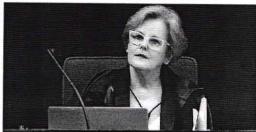
Para a ministra Rosa Weber, Fundef tem como objetivo reduzir as desigualdades

estado. Esse seria o valor mínimo por aluno. Se o estado não tivesse condições para depositar no fundo esse valor, a União complementaria. Os estados, porém, defenderam outro entendimento, bem diferente: o valor global das receitas arrecadadas pela União deveria ser dividido pelo número de alunos matriculados em todos os estados. Esse seria o mínimo gasto por aluno em todo o país. O estado que não obtivesse esse mínimo no Fundef teria complementação da União. Esta foi a interpretação vitoriosa para o STF.